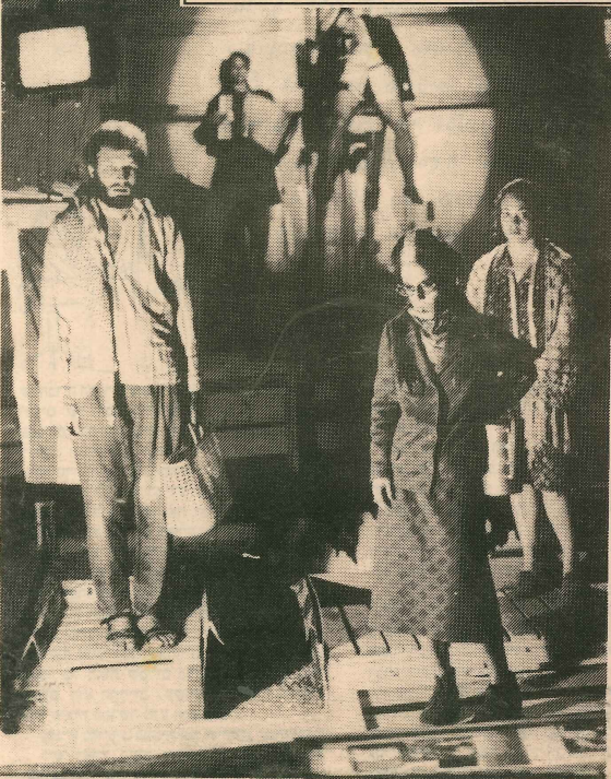
ה' תשרי תשנ"ב - 13.9.91

"היא שולחת יד אל פי ערוותה, ומוציאה משם פרוסת לחם"